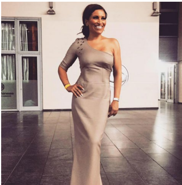
Patricia Blanco moderiert zusammen mit Axel Kahn die 1. INTERNATIONALE PIXX LOUNGE in Port Adriano auf Mallorca

Patricia Blanco (eigentlich Patricia Zerquera; 18. Januar 1971 in Unterhaching) ist eine deutsche Reality-TV-Darstellerin.