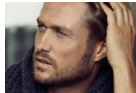
Nico Schwanz, Fotomo- dell, Fernsehdarsteller & Sänger