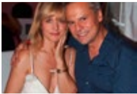
Nastassja Kinski, deutsche Schauspielerin

Download: www.pixx-agentur.de/download/PM_Bilder_1_2017.zip