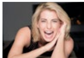
Giulia Siegel, DJ, Model, Schauspielerin, Moderatorin