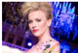
Eva Felicitas Habermann, Schauspielerin & Moderatorin