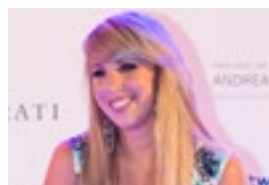
Annemarie Eilfeld, Sängerin