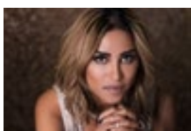
Sabrina Setlur, Sängerin