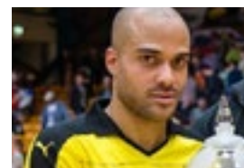
David Odonkor, ehemaliger deutscher Fußballspieler