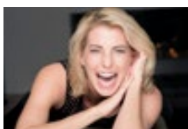
Giulia Siegel, DJ, Model, Schauspielerin, Moderatorin