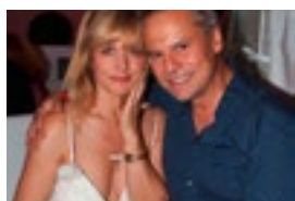
Nastassja Kinski, deutsche Schauspielerin

Download: https://www.dropbox.com/s/bds6thdntp0wir/1%20PIXX%20LOUNGE%202017%20Nachbericht%20Auswahl.zip?dl=0